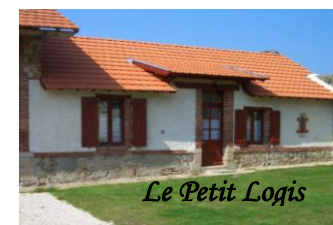
Le Petit Logis