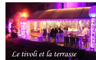
Le tivolì et la terrasse